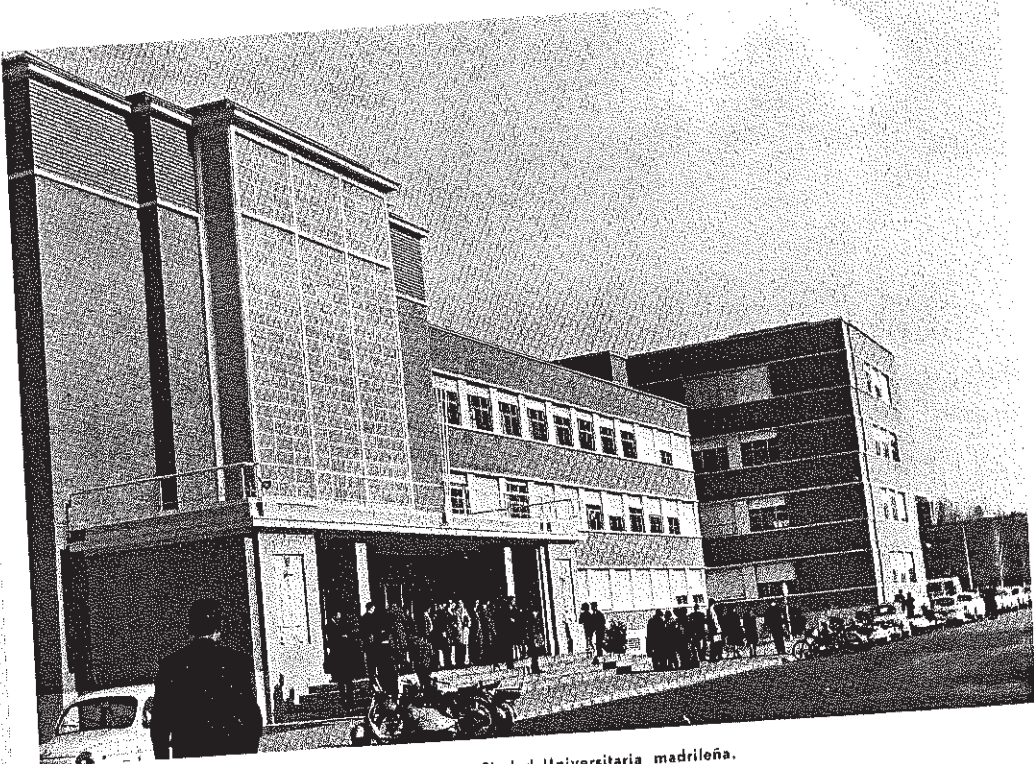
Un aspecto de la Facultad de Derecho de la Ciudad Universitaria madrileña.

Los estudiantes iberoamericanos y filipinos pueden solicitar en Madrid, facilitado por el Instituto de Cultura Hispánica, la asistencia de un médico de Medicina General, totalmente gratuito. El único requisito que se pide es la presentación del carnet del Instituto. De esta forma se vela por la salud y se garantiza, ante cualquier eventualidad, la seguridad de estos estudiantes.