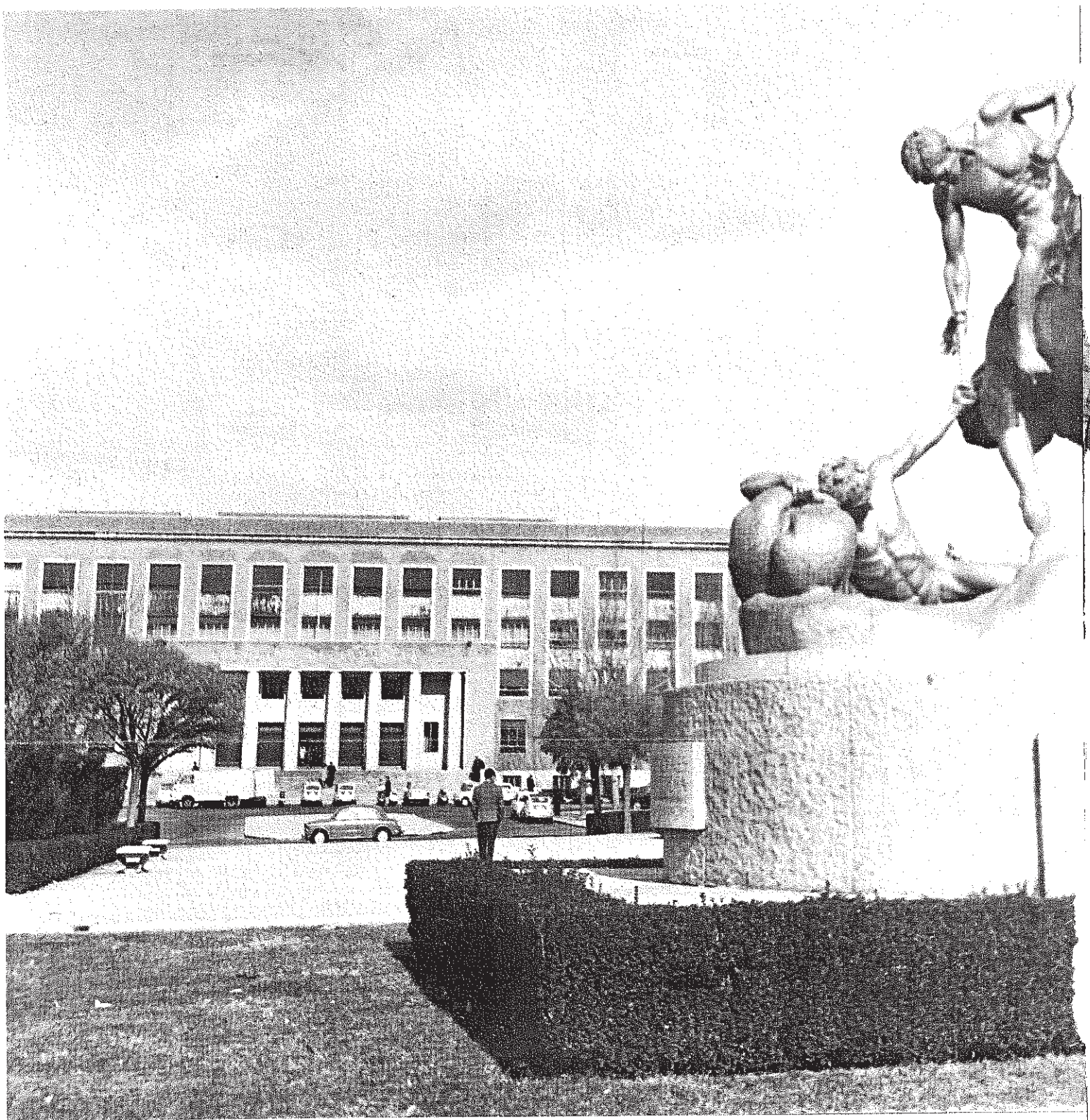
La antorcha de la vida, el relevo, la continuidad. Grupo escultórico erigido frente a la facultad de Farmacia, en la Ciudad Universitaria de Madrid.