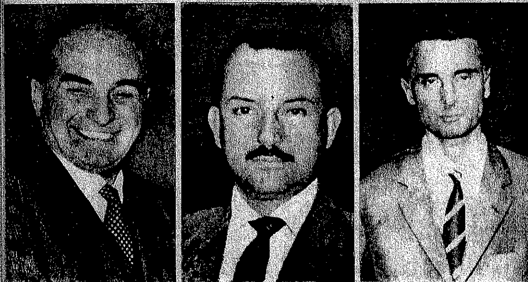
Socialistas: La ortodoxia de Tanassi y Ferri versus el ascendente Giolitti.

En Nueva York residen millón y medio de afroamericanos y más de dos