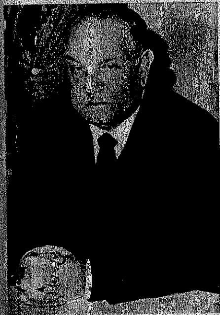
De Martino: Levantar la sinistra.