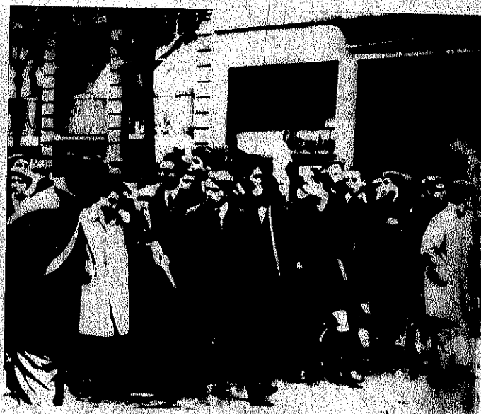
Este Ejército, fortalecida columna vertebral; esos carlistas...

los jefes militares suelen hacer en España recordó, hace ya dos años, que "el Ejército está ampliamente despolitizado", y dedujo de esa situación de custodios prescindentes que no había por el momento "peligro de una revuelta de coroneles". Más aun, consideró a su poder lo suficientemente asentado, maduro, fuerte, como para evidenciarse partidario de sobrellevar las manifestaciones estudiantiles y las huelgas de aquellos días "con paciencia", aunque algunos, alertó, "tienden a resolverlas de manera radical. Es una tendencia que estimo desgraciada —atajó— porque, a mi juicio, hay que encajar todo con una enorme paciencia". Y fue más lejos todavía, no dudó en informar que, después de Franco, deseaba "un funcionamiento del poder civil lo suficientemente sano como para que ninguna intervención sea necesaria".