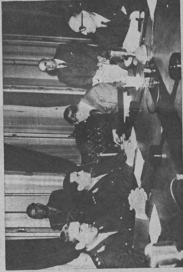
Los factores de poder: el presidente Frondizi y las fuerzas armadas.

El señor Vitolo, ministro del Interior, ha contribuido a las tres victorias consecutivas del partido gubernamental en las últimas elecciones locales.